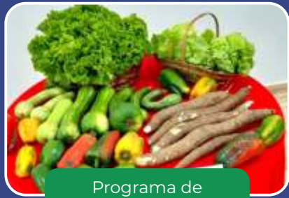
Programa de Aquisição de Alimentos (PAA).