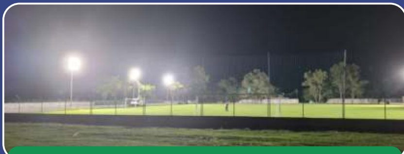
Iluminação do Campo Municipal Agostinho Angelini.