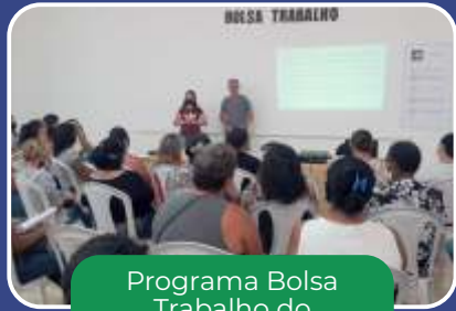
Programa Bolsa Trabalho do Governo do Estado em parceria com os municípios.