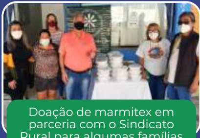
Doação de marmiteix em parceria com o Sindicato Rural para algumas famílias de situação de vulnerabilidade social durante a pandemia.