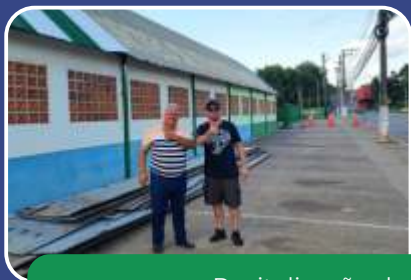
Revitalização do Ginásio de Esportes.