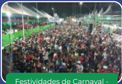
Festividades de Carnaval - Porangasamba.