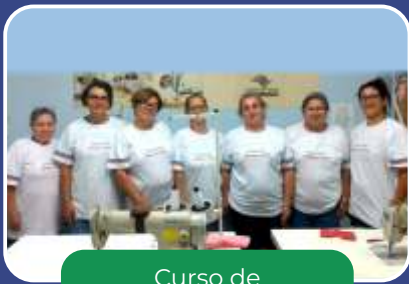
Curso de Qualificação Profissional – Costureiro.