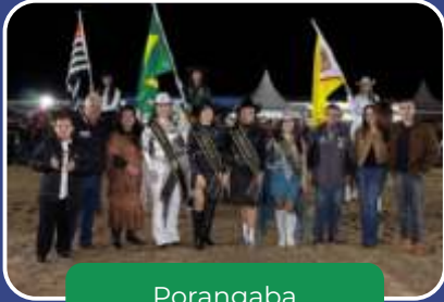
Porangaba Rodeo Show.