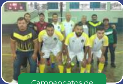
Campeonatos de Futebol de Salão.