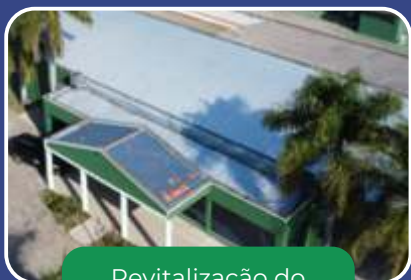
Revitalização do Centro de Lazer do Trabalhador.